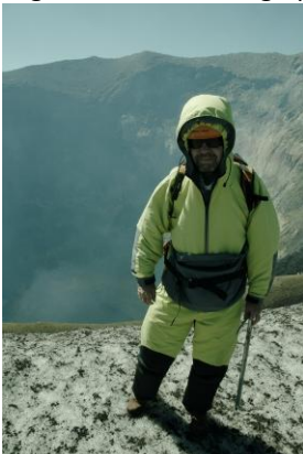
Op de top van de vulkaan

Dag 11 staan we vroeg op omdat we ongeveer 65 km moeten fietsen voordat we in Neltume aankomen. We moeten de douane passeren (kan oponthoud geven; zorg dat u geen fruit of andere levensmiddelen invoert, in geval van twijfel zeker aangeven want de boetes kunnen fors oplopen!) en de enige ferry MOET gehaald worden.