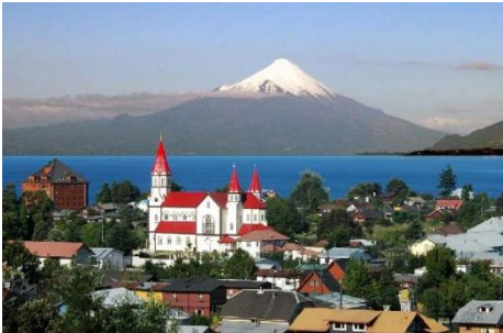
Puerto Varas met vulkaan Osorno

Om bij te komen van de reis en te acclimatiseren in Santiago, is zondag 13 november meteen een rustdag. Voor degenen die de stad wat nader willen leren kennen, organiseren we een stadsexcursie langs historische gebouwen, parken en een heuvel in het centrum van de hoofdstad, Cerro San Cristobal.