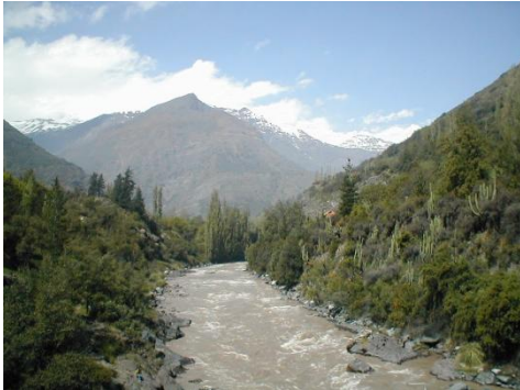
Cajón de Maipo

wandelaars). Alternatieven zijn canopy (aan een kabelbaan tussen boomtoppen door suizen), een nationaal park bezoeken en de hele dag wandelen in oorspronkelijke bossen, of een excursie op een paard met uitleg door een lokale Mapuche gids over de gebruiken van de oorspronkelijke bewoners van het zuiden van Chili en Argentinië.